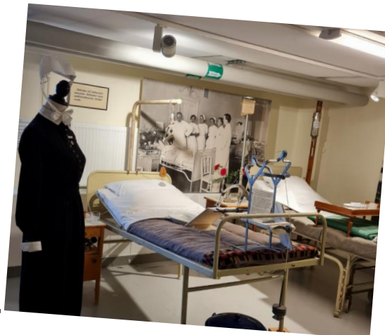
Samma sal januari 2025!