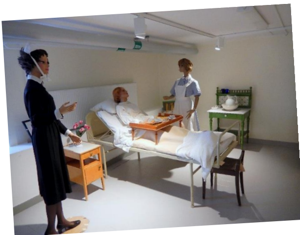
Vårdsaken vid museets invigning 2016

Museet har haft öppet hus och ett antal inbokade visningar. Arbetet med att utveckla museet fortsätter oförtrutet. Föremål med information har utlånats till KTC, Polismuseet i Sala och Regionhuset Ingång 4.