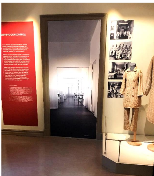
Museet i Göteborg