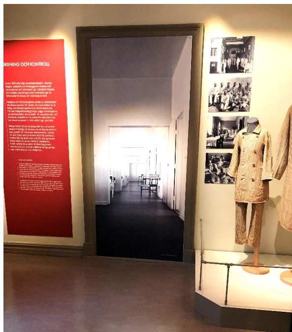
Museet i Göteborg